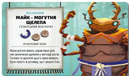
Карта борця: сторона Ліги Юніорів