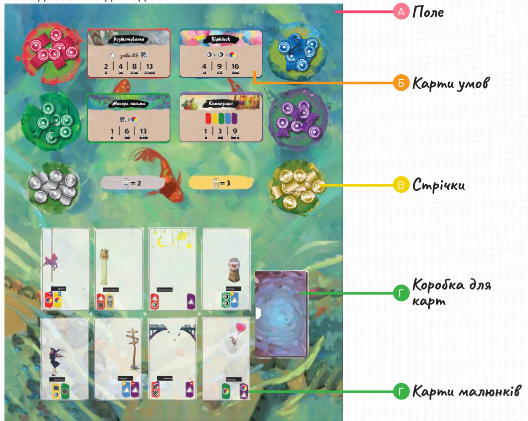
Г Карти фону в протекторах