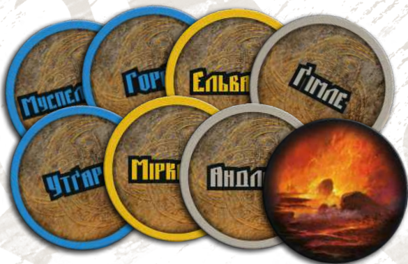
8 жетонів Рагнароку