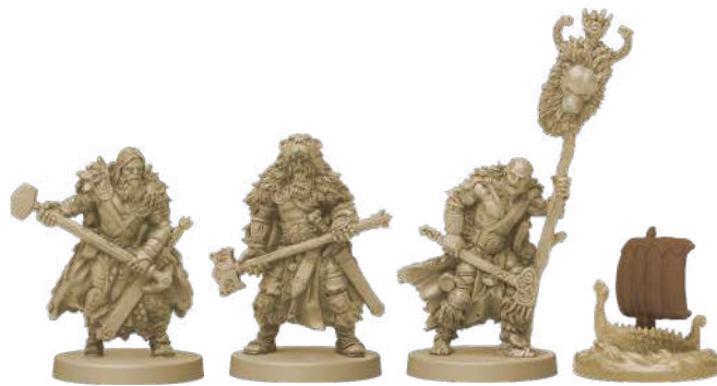
10 фігурок клану Ведмедя (8 воїнів, 1 ярл, 1 дракар)