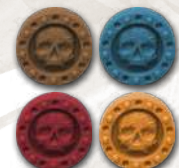
4 маркери очок слави (по 1 кожного клану)