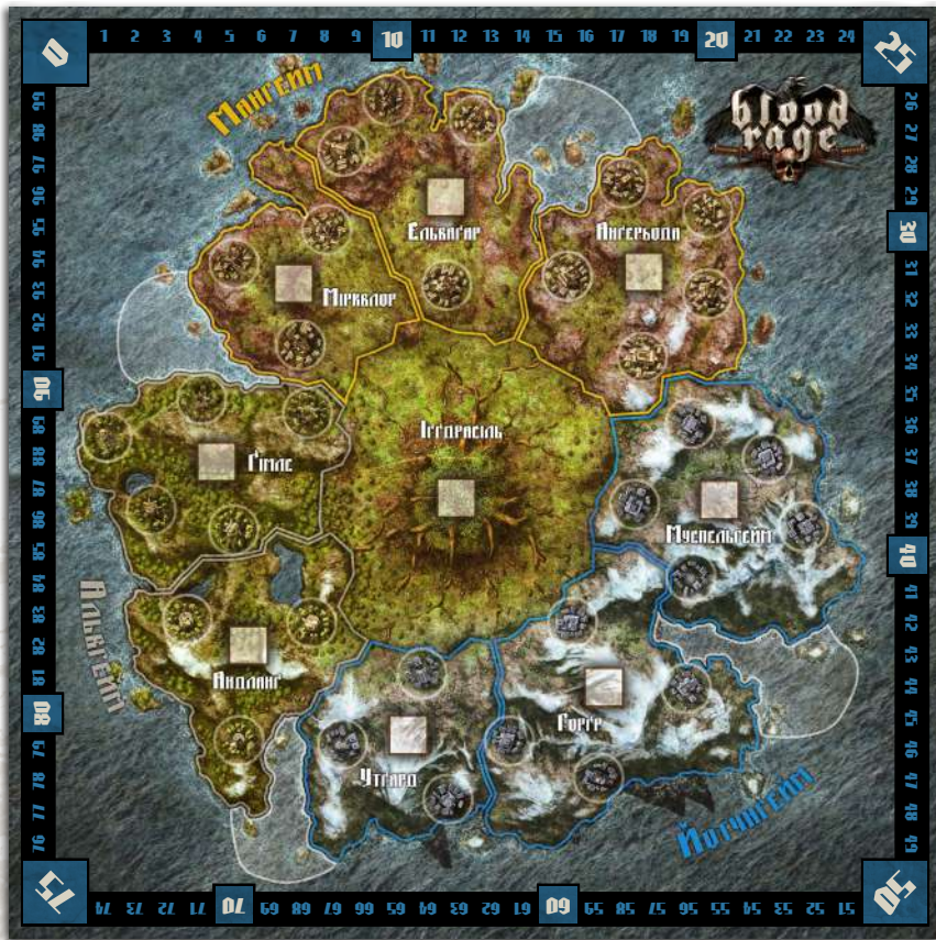
1 ігрове поле