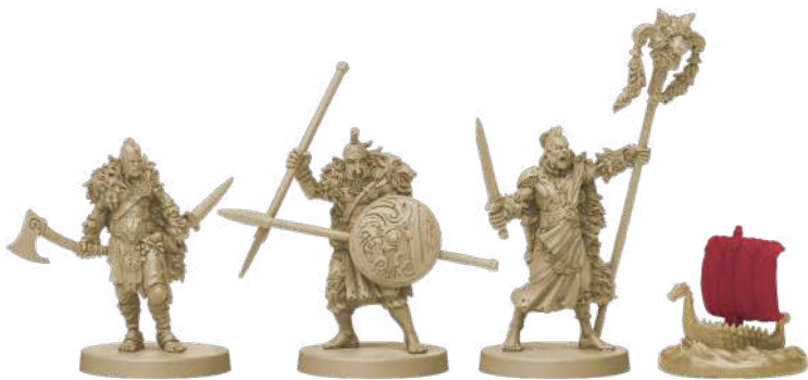
10 фігурок клану Вовка (8 воїнів, 1 ярл, 1 дракар)