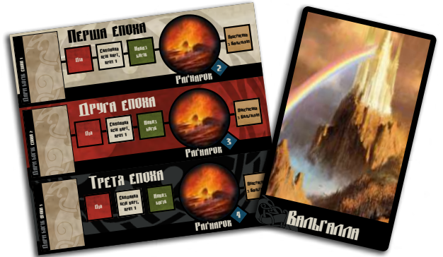
1 планшет епох