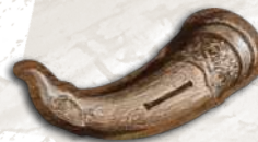
1 жетон першого гравця