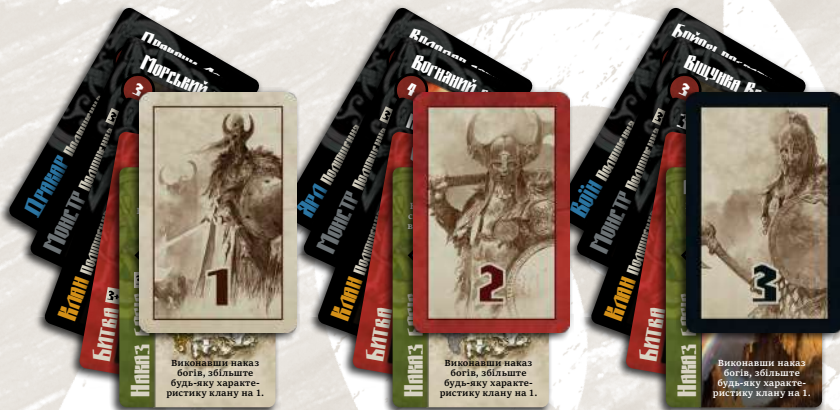
102 карти (3 колоди по 34 карти)