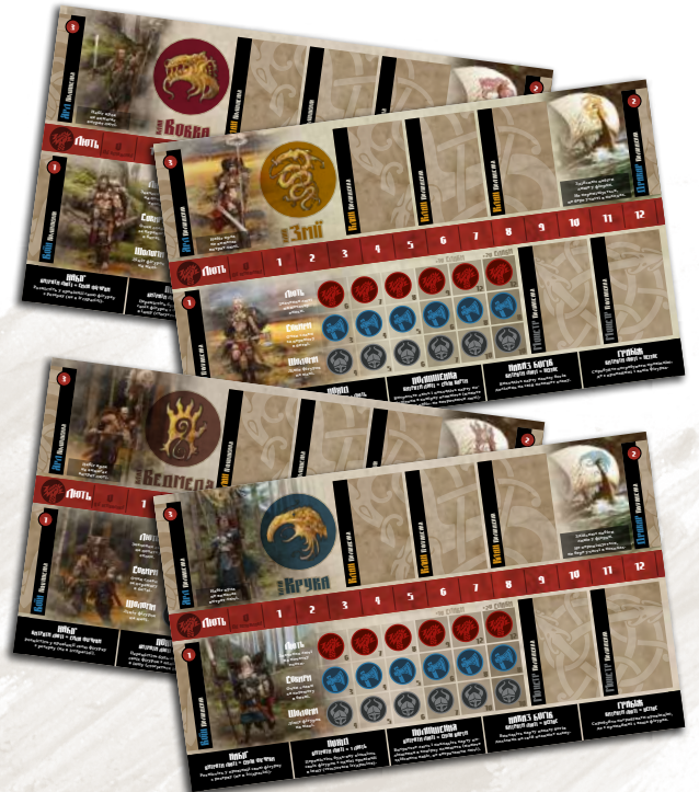
4 планшети кланів