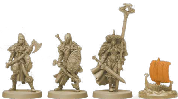
10 фігурок клану Змія (8 воїнів, 1 ярл, 1 дракар)