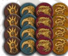
16 жетонів кланів (по 4 кожного клану)