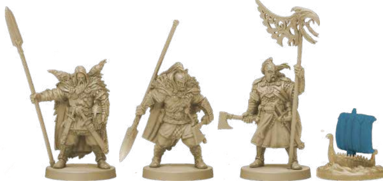
10 фігурок клану Крука (8 воїнів, 1 ярл, 1 дракар)