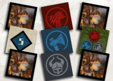
9 жетонів грабежу