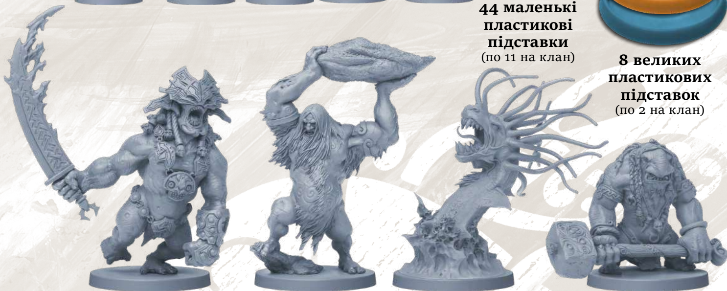
9 фігурок монстрів