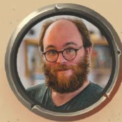
ЛЕАНДР ПРУСТ ГЕЙМДИЗАЙН І ВИДАВНИЦТВО