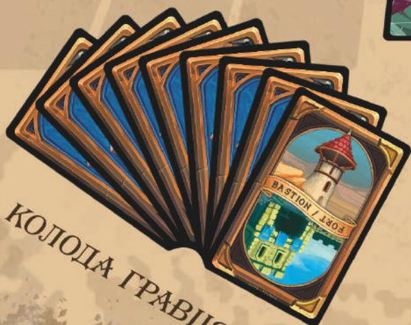
КОЛОДА ГРАВЦЯ А