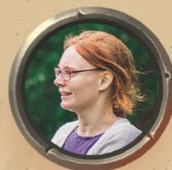
АДЕЛІН ДЕЛЕ ВИДАВНИЦТВО І ЛОГІСТИКА