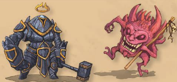
КОРОЛІВСТВО ГРАВЦЯ А

Виняток: ви не можете обрати формат "битва" для соло-режиму.