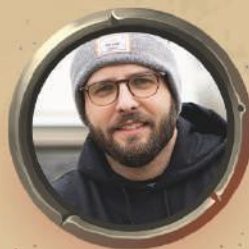
КЛЕМЕНТ ПРУСТ ГРАФІЧНИЙ ДИЗАЙН