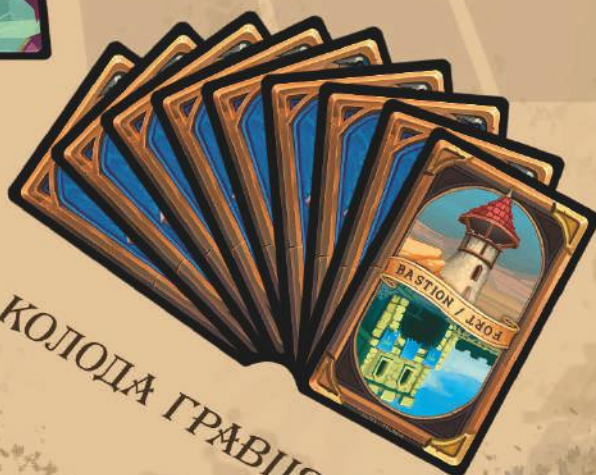
КОЛОДА ГРАВЦЯ Б