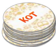
Набор с короткими словами