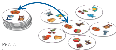
Рис. 2. Начальный вариант игры

Все жетоны на столе лежат картинками вверх, игроки смотрят свои жетоны тоже со стороны картинок. Задача игрока — найти парный жетон с такой же картинкой (хотя бы одной!), забрать его к себе в стопку картинкой вверх, и искать теперь пару к нему.