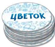
Набор с длинными словами