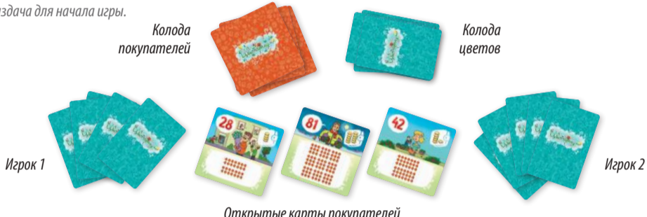
Рис.1. Раздача для начала игры.

Игроки ходят по очереди, по часовой стрелке, первым начинает ходить самый младший.