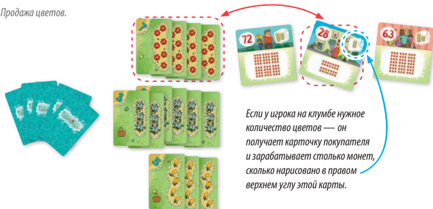
Рис.3. Продажа цветов.

Чтобы получилось нужное для продажи количество цветов, игрок может перед продажей выкорчевать часть клумбы: убрать с неё одну или несколько карт. Убирать можно как карты цветов, так и карты повышения урожайности (волшебные лейки и цветики-семицветики).